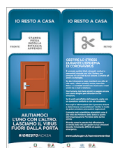
#IORESTOACASA: dillo ai tuoi vicini!