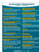
Domande frequenti ai tempi del coronavirus. #iorestoacasa