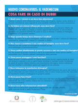
Nuovo Coronavirus, il vademeccum. Cosa fare in caso di dubbi