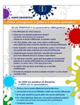
Come raccogliere e gettare i rifiuti domestici